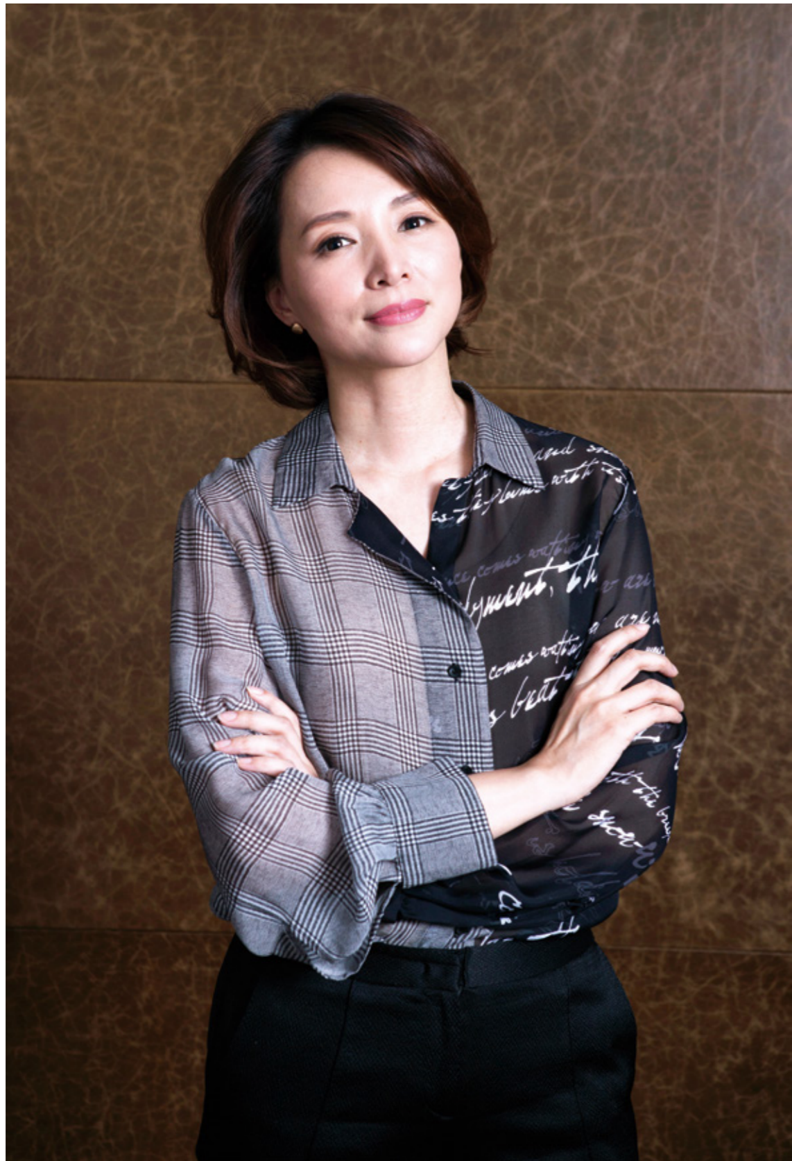
董卿 著名主持人，北京星河湾业主