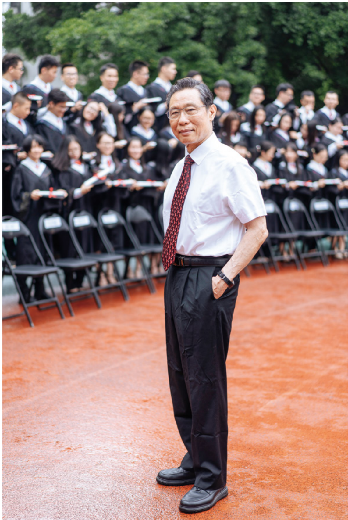
钟南山 中国工程院院士, 广州星河湾业主