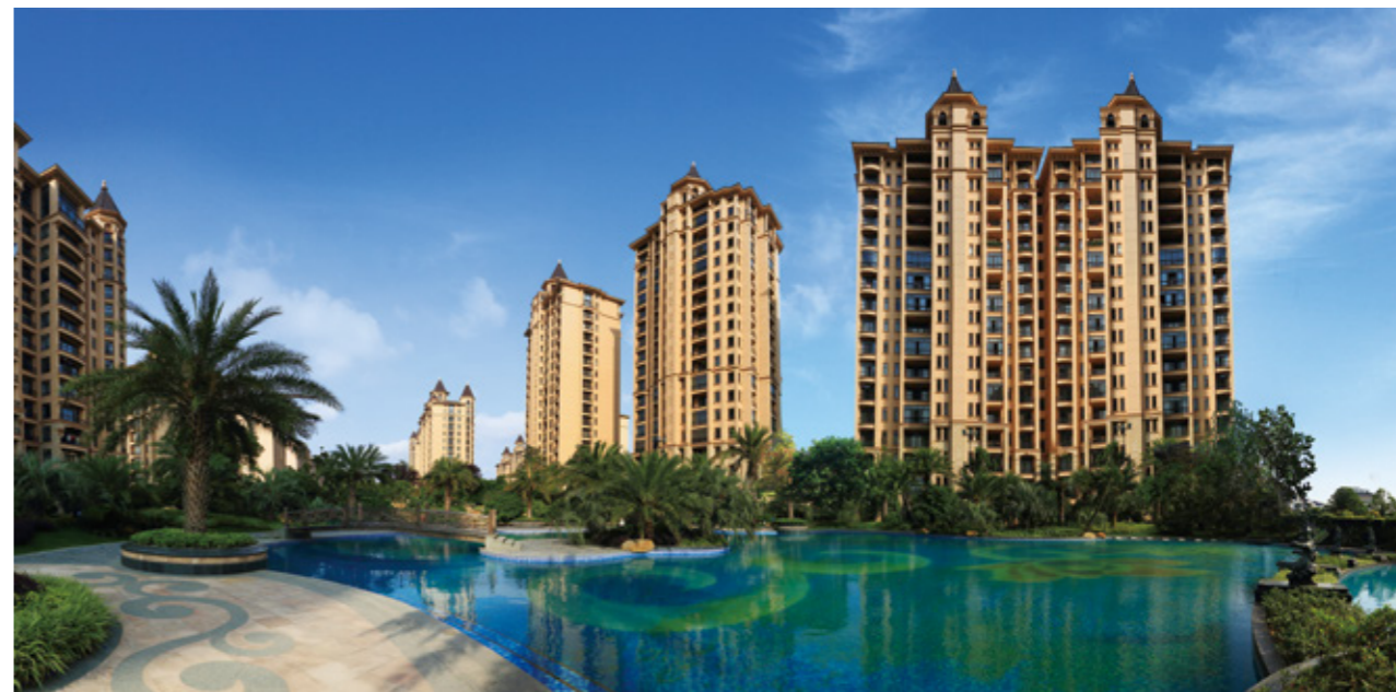
江南春表示, 自己是星河湾的忠实爱好者

也许你并不认识江南春,但他一定在你的生活中出现过。写字楼、公寓、超市……无所不在的分众屏幕,植入了你每天生活的必经路径,让你有意无意间被分众的广告包围着。如果说电梯媒体的出现拯救了现代人的无聊和他们无处安放的眼神,也不为过,“这就是广告应该存在的场景。”