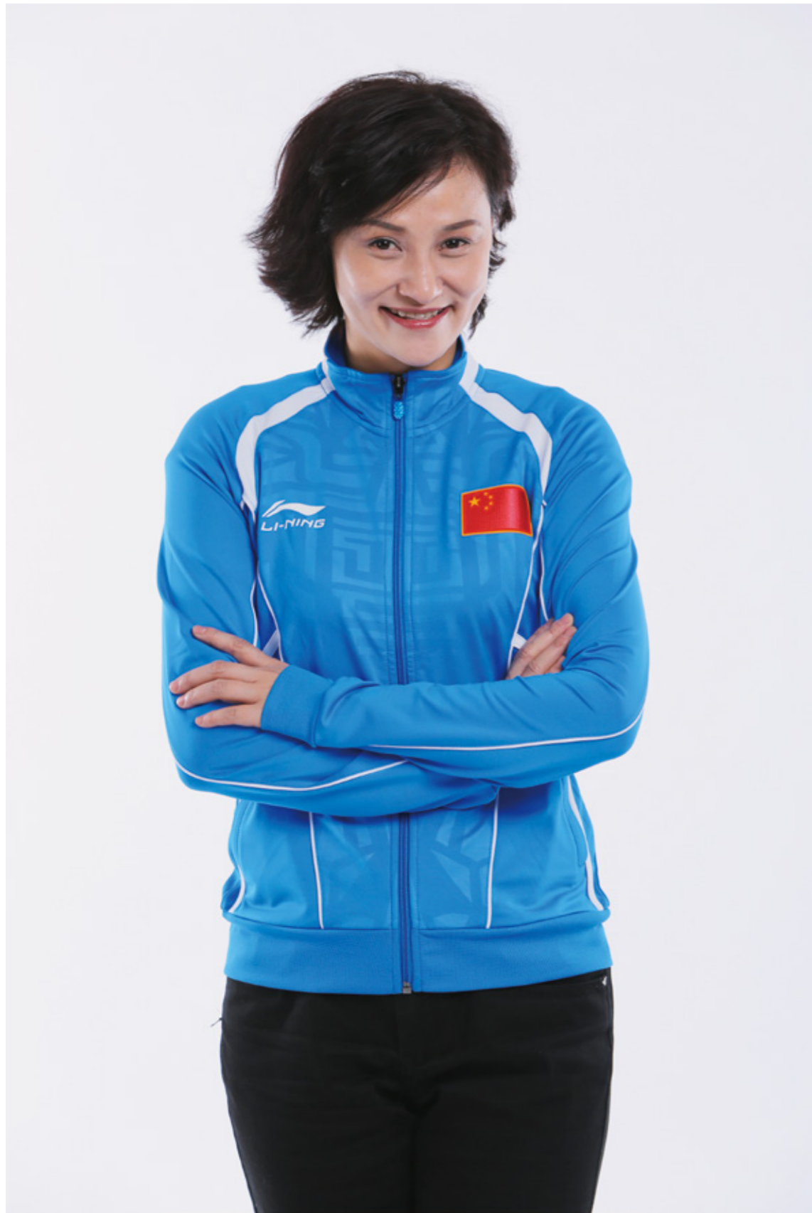
高敏 奥运冠军, 北京星河湾业主